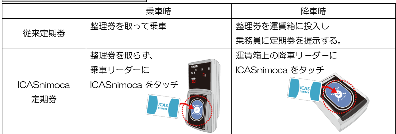
利用方法 新旧対照表